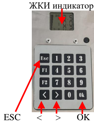
Рис.№1. Расположение элементов интерфейса.

Управление режимами индикации и программирования производится нажатием управляющих клавиш.