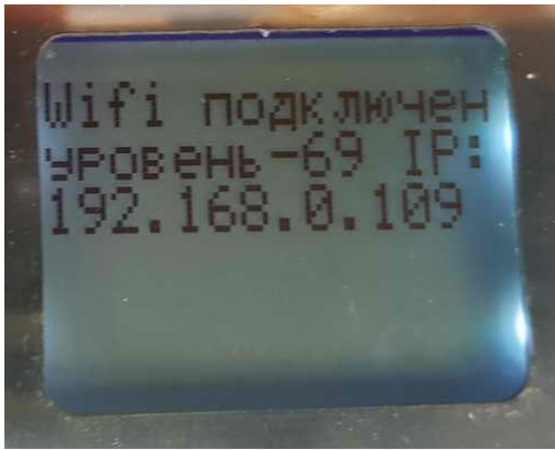
Рис.№5. Экран контроллера при подключении к сети WIFI.

Доступ к сайту контроллера «Фотон-ИюТ» возможен с терминала, находящегося в этой же локальной сети. Для этого в адресной строке браузера на терминале необходимо ввести вышеуказанный IP адрес контроллера.