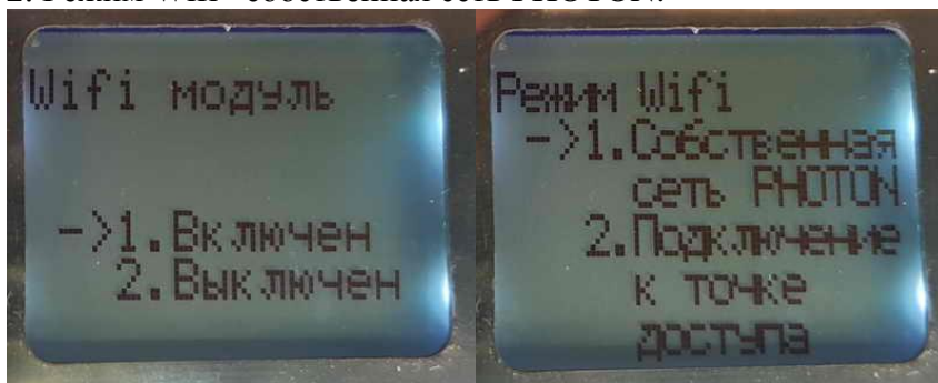
Рис.№1. Настройка контроллера через меню программирования.