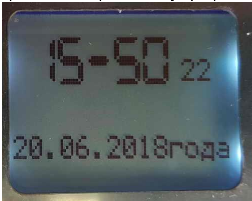
Рис.№6. Настройка часов реального времени через меню программирования.

Для построения правильных графиков логирования, в контроллере должна быть корректно установлена дата и время. Эти данные хранятся в автономных часах реального времени (RTC) и настраиваются через систему программирования, вкладка «дата и время».