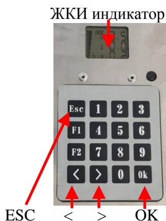
Рис.№1. Расположение элементов интерфейса.

Управление режимами индикации и программирования производится нажатием управляющих клавиш.