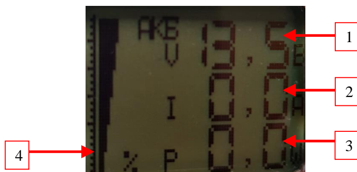
Рис.№2. Индикатор в режиме краткого отображения электрических параметров.

Переход между этими наборами осуществляется кнопками < и >.