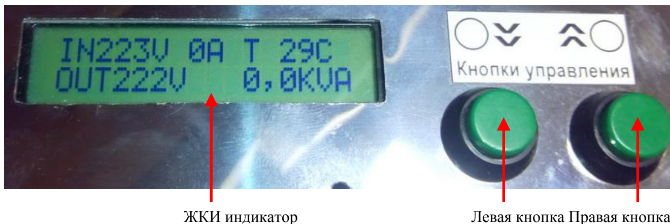
Рис.№1. Расположение элементов интерфейса.

Управление режимами индикации и программирования единообразно и использует команды, вызываемые комбинациями из нажатий кнопок различной длительности. При нажатии выбранная команда изображается в виде значка в правом верхнем углу экрана (пункт б на рис.№2).